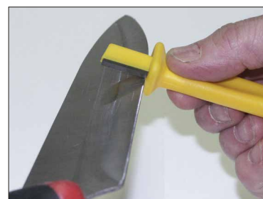
Dra alltid utåt mot spetsen.

Fatta verktyget med fingrarna och håll verktyget i ca 45 graders vinkel. Håll kniven med andra handen och med knivspetsen utåt från dig. Slipa alltid från fästet och ut mot spetsen. Vinkla verktyget mot eggen på kniven så pass mycket att du känner att det tar. I det här momentet är det vanligt att man har för liten vinkel. Beroende på olika stål i knivar, kan det kännas olika hur det tar, men stålet biter även om det kan tyckas gå lätt.