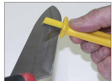
Dra alltid utåt mot spetsen.

Fatta verktyget med fingrarna och håll verktyget i ca 45 graders vinkel. Håll kniven med andra handen och med knivspetsen utåt från dig. Slipa alltid från fästet och ut mot spetsen. Vinkla verktyget mot eggen på kniven så pass mycket att du känner att det tar. I det här momentet är det vanligt att man har för liten vinkel. Beroende på olika stål i knivar, kan det kännas olika hur det tar, men stålet biter även om det kan tyckas gå lätt.